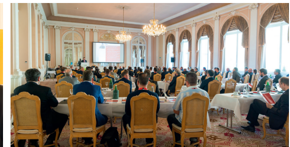
Rund 100 Teilnehmer lauschen im schönen Belle Epoque Saal den Ausführungen des Referenten Michael Krähenbühl, proparis Vorsorge Gewerbe Schweiz.